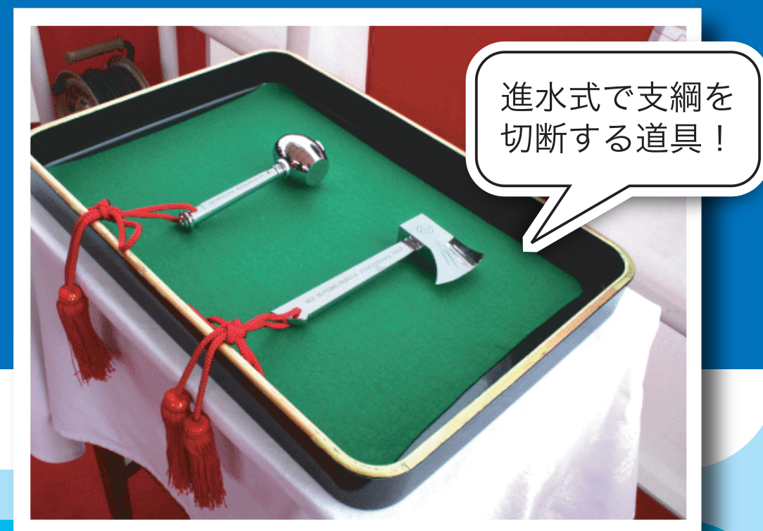
進水式で支綱を切断する道具！